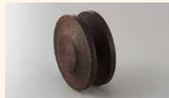
レトロコードリール (茶)