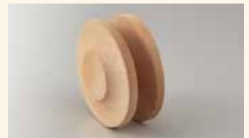
レトロコードリール (生地)

¥1,980(税込) ¥1,800(税抜) 幅約4.0cm・高さ約7.5cm・内幅約1.5cm・重量約54g ・木製(オイルステイン仕上げ) ※約40cm調整可能